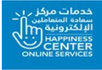
خدمات مركز سعادة المتعاملين