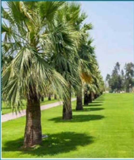
مشروع حصر النباتات يقدم بيانات ذكية عن أشجار إمارة عجمان.

يعمل فريق مشروع حصر النباتات والذي يتضمن أعضاء من إدارة الزراعة والحدائق العامة وإدارة البيانات المكانية بدائرة البلدية، على تنفيذ المشروع الحيوي حيث تم تقسيم مراحل العمل بالمشروع إلى ثلاثة مراحل، استهلكت بتغطية 29 منطقة في مدينة عجمان من إجمالي 46 منطقة ليتم حصر 33% من الأشجار في مدينة عجمان