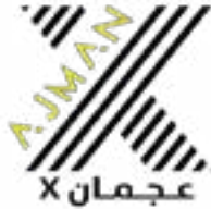
مركز عجمان X